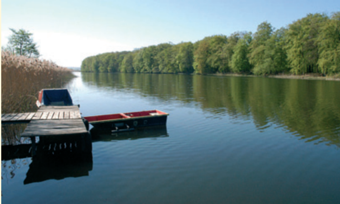
Der Sumter See